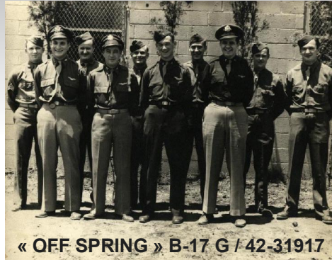
« OFF SPRING » B-17 G / 42-31917